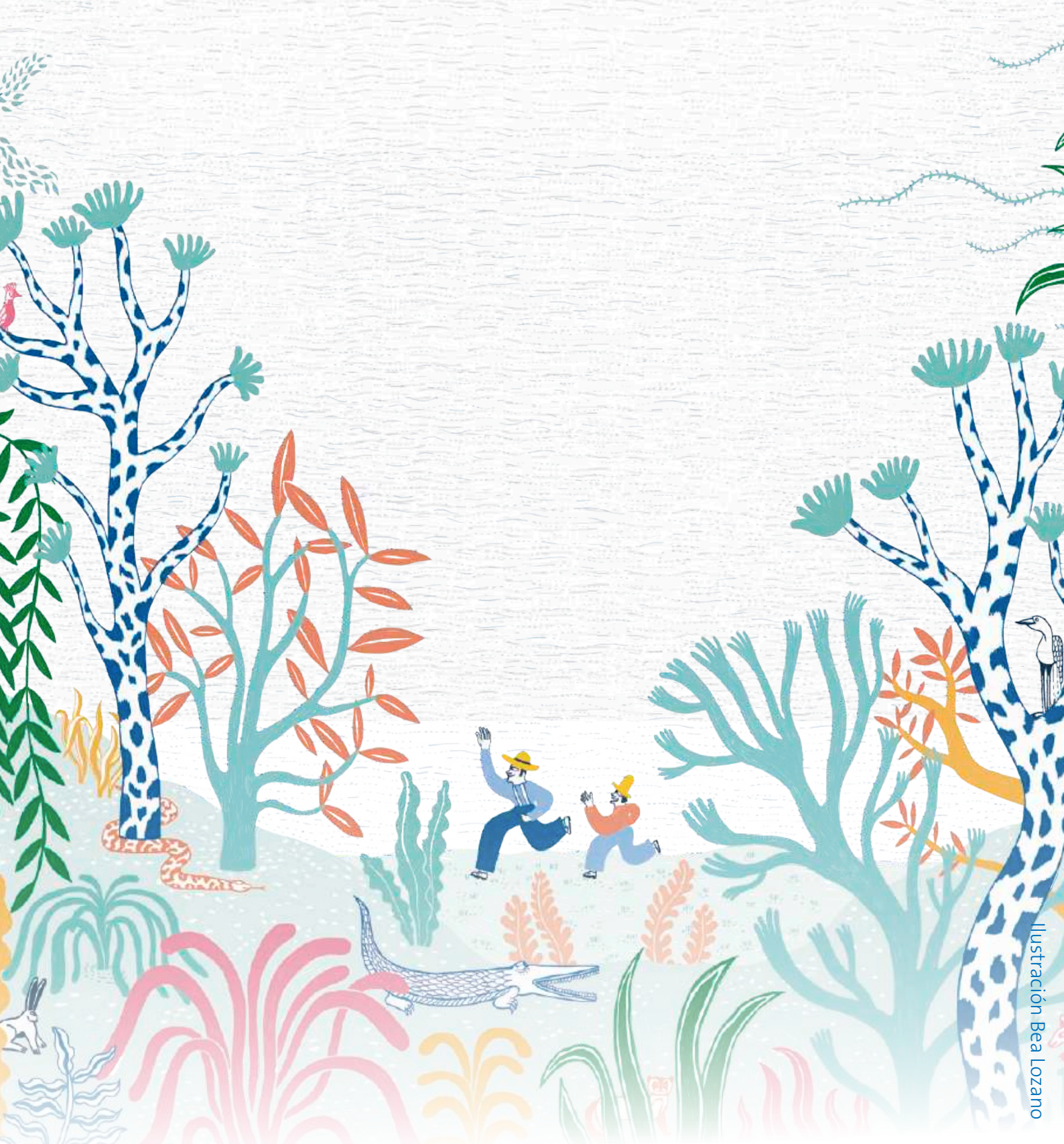
Ilustración Bea Lozano